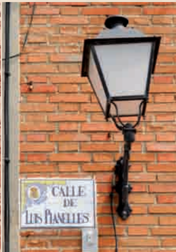
A la izquierda, plano de 1867 en el que aparece destacada la calle con su anterior denominación, de las Monjas. A la derecha, placa con el nombre actual, que adquirió en 1924.

Monjas vivían 150 personas de los 3.000 habitantes con que contaba Valdemoro, el mismo número que en la calle Grande -hoy Estrella de Elola-, a pesar de la mayor extensión de esta última. Había vecinos procedentes de Toledo, Ciudad Real, Málaga, Zamora o Castellón, llegados a la localidad a raíz de un matrimonio con un oriundo de Valdemoro o bien por motivos laborales -fundamentalmente por pertenecer a la Benemérita-, aunque en su mayoría eran nacidos en el municipio.