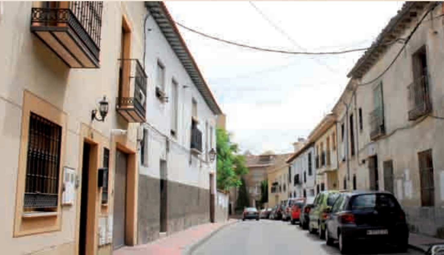
La calle Luis Planelles comienza en la plaza de las Monjas -al fondo de la imagen se puede ver el convento de la Encarnación- y finaliza en la intersección de Seseña, San Gregorio, Aguado y plaza Duque de Ahumada.