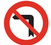
Giro a la izquierda prohibido (también el cambio de sentido)