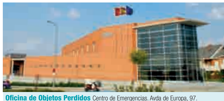
Oficina de Objetos Perdidos Centro de Emergencias. Avda de Europa, 97.

Se ha comprobado que las llaves, ya sean de coche o del hogar, son lo menos reclamado y, en consecuencia, lo que resulta más difícil de devolver a sus dueños, razón por la cual, transcurrido un tiempo, se trasladan a Jefatura para su almacenamiento y archivo y posterior destrucción. También se procede del mismo modo si, una vez comunicado a su propietario que existe un objeto que le pertenece y está custodiado por la Policía, transcurren tres días sin que se haya presentado a retirarlo. ■